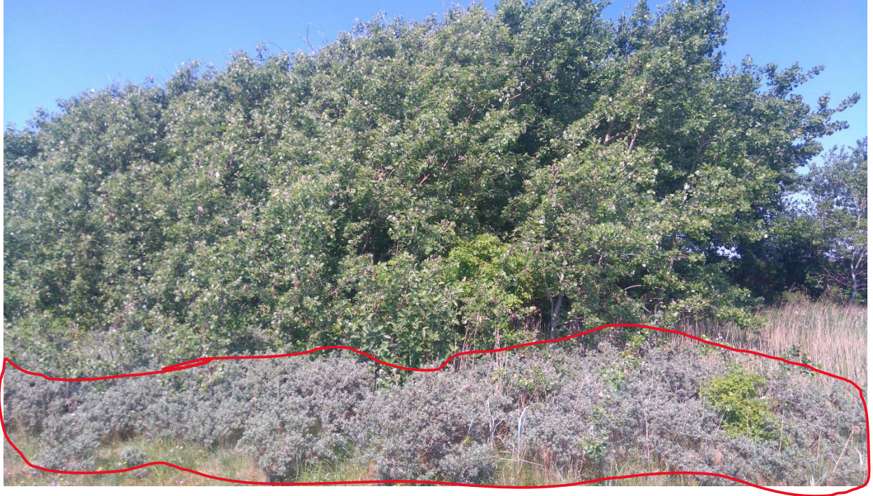
Figur 5: Der er havtorn stort set hele vejen rundt om krattet. Havtorn er relativ sjælden i Struer Kommune og må derfor ikke ryddes. På billedet er havtorn-bevoksningen markeret med rød streg omkring.