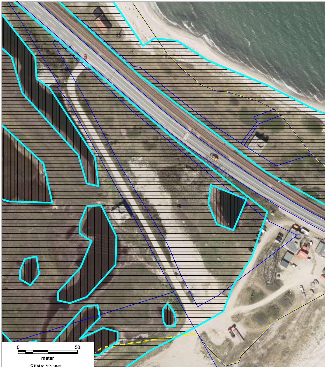
Figur 3: Det lyseblå skraverede er beskyttet strandeng og det mørkeblå skraverede er beskyttede vandhuller.