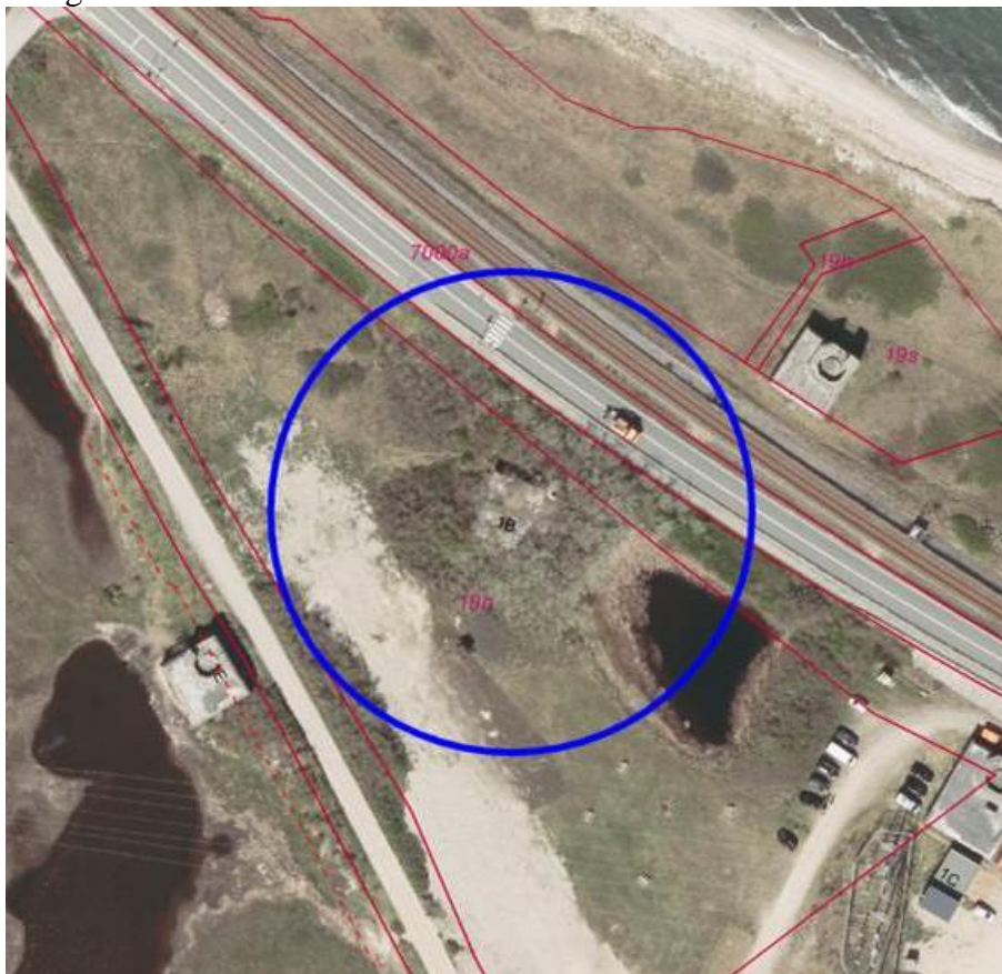
Figur 1: Markering af projektområdet, hvor der er ansøgt om rydning af krattet på stranden omkring bunkeren.