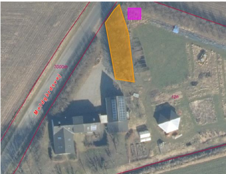
Figur 2 – Den orange polygon viser træbevoksningen der skal bevares jf. vilkår. Den lille firkant viser den ønskede placering af husstandsvindmøllen.

Ansøger står selv for tinglysningen af fjernelsesdeklarationen inkl. udarbejdelse af tinglysningsdokument og rids. Ansøger skal dog indsende tinglysningsdokument og rids til teknisk@struer.dk til godkendelse inden der meddeles byggetilladelse.