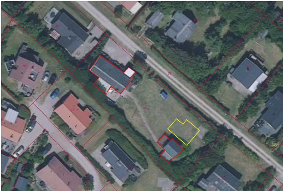
Oversigtskortet viser eksisterende sommerhus og tilhørende bebyggelse med rød streg og placering af ny garage og drivhus med gul streg.

SAGSBEHANDLER: EVA POULSGAARD THRANE E: evapt@struer.dk